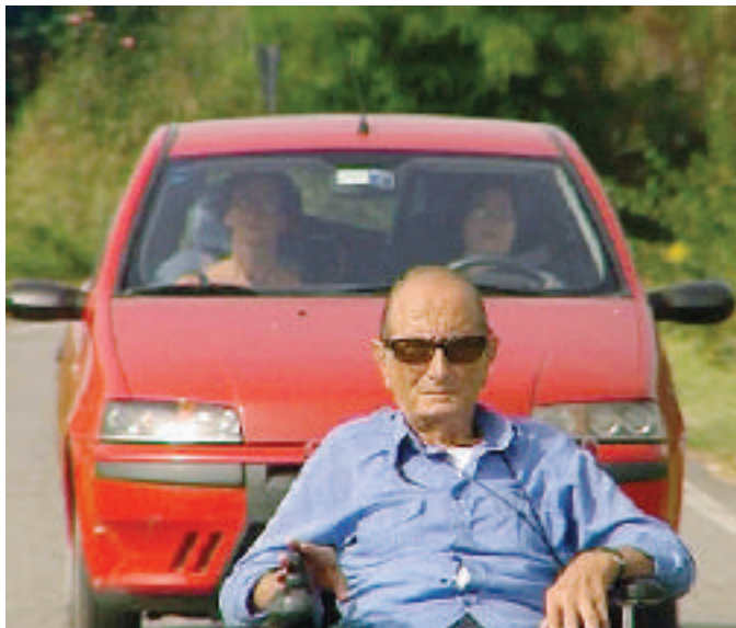
Una scena del film che verrà proiettato al Teatro Angelini